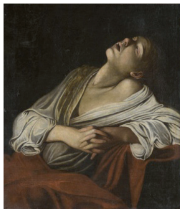
Muller en éxtase Anónimo Século XVII Óleo sobre lenzo

Noutras ocasións, a arte preséntanos a morte como metáfora do soño eterno, un soño do que non se esperta. Dende a aparición do home, a morte é unha parte daquilo que foi en vida e que permanece entre nós, polo que xa nas primeiras culturas xorde a necesidade de rodear o defunto de ritos funerarios, como as máscaras e enxovais que actúan de nexo de unión entre os dous mundos, o dos vivos e o dos mortos. De aí a frase tópica " Somnium imago mortis ". E como dicía o poeta: