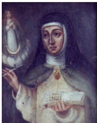
Sor María Jesús de Ágreda Anónimo Século XVII Miniatura ao óleo sobre prancha de cobre

A arte ofrécenos a oportunidade de achegármonos ao complexo mundo dos soños e de analízalo dende diferentes perspectivas. Na arte cristiá, por exemplo, son moi frecuentes as representacións dos chamados "soños místicos", experiencias a través das cales Deus se comunica con determinadas persoas para transmitirlles unha mensaxe que nas Sagradas Escrituras son clasificadas coma sinais do ceo.