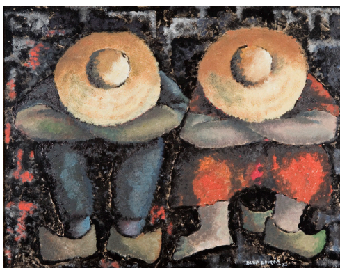
A sesta, 1974