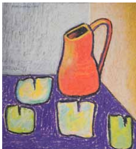
Sen título. Ceras e pastel sobre cartón (1964). 32 × 30 cm