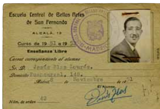
Carné da Escola de Belas Artes de San Fernando