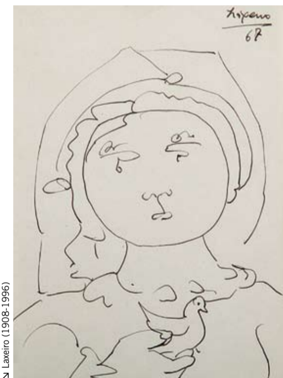
↳ Laxeiro (1908-1996)

A partir dos anos 60, primará a neofiguración, sen esquecer o expresionismo e a total apertura ás vangardas artísticas mundiais. Neste marco temporal, tamén