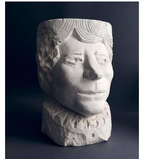
Rosalía (matriz), 1969

Esta mostra forma parte do convenio de colaboración asinado en 2017, entre a Deputación de Lugo e a Fundación Sargadelos, no que se desenvolveron diferentes talleres cerámicos e workshops , realizados no CENTRAD de Lugo e nos obradoiros de Sargadelos en Cervo.