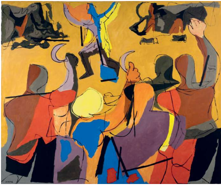
O Meco, 1963 Col. Museo de Arte Contemporánea Carlos Maside

Luis Seoane (Bos Aires, 1910 – A Coruña, 1979) é o gran renovador do deseño galego no século XX, con propostas gráficas de vangarda, xa sexa nos seus libros ou carteis, aportando novas solucións ao deseño cerámico nos anos sesenta ou no especial cromatismo dos seus tapices, onde se mestura o mellor dos seus debuxos e as solucións técnicas que fixeron paradigmática a súa pintura.