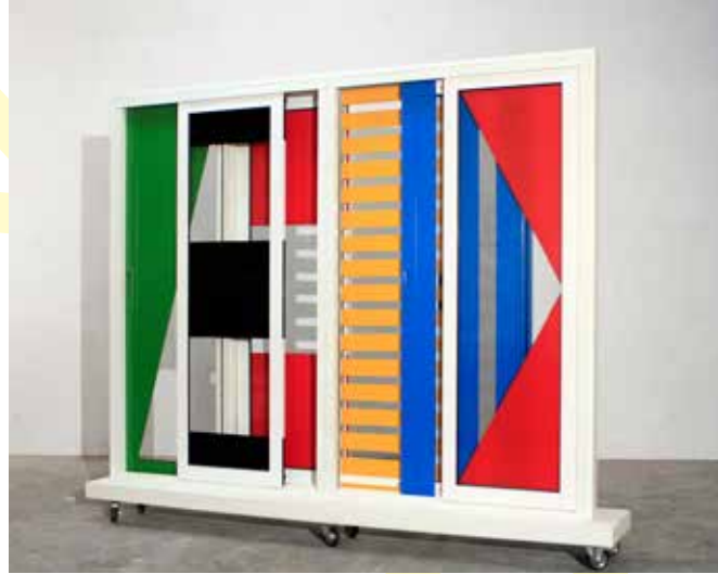
>> Standar-Te. Instalación: xanelas corredeiras de aluminio e pintura esmalte. 2017