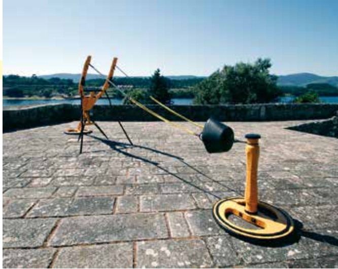
>> Carro de combate. Instalación: madeira, ferro, gomas elásticas e cubo de goma. 2017