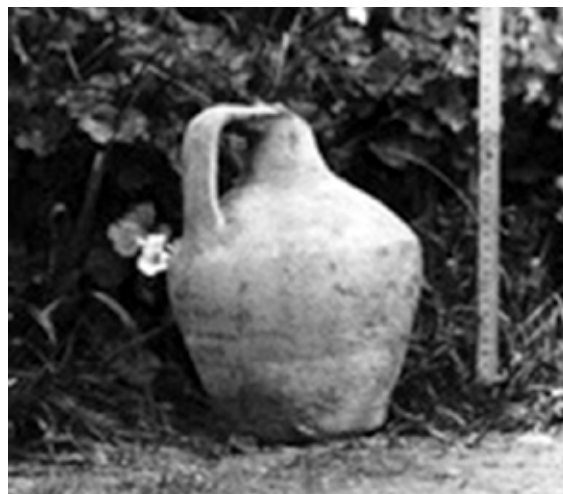
Fig. 7b. Vasija localizada en el interior de la tumba de Ermengon (Túnez); probablemente procedente de inhumación posterior