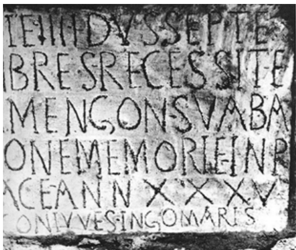
Fig. 8. Estela funeraria de Ermengon ( Hippo Regius , Annaba, Túnez): Die III idus septe/mbres recessit E/rmengon, Suaba, / bon(a)e memori(a)e in p/ace, ann(o) xxxv. Coniuues Ingomarís (König 1981, Taf., 50a)