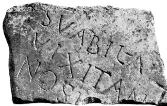
Fig. 9. Inscripción de Svabila ( Hippo Regius , Annaba, Túnez)