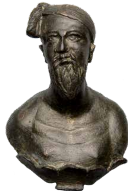
Fig. 5. Busto de bronce representando a un «guerrero suevo», hallado en el campamento militar romano de Brigetio (Hungría).