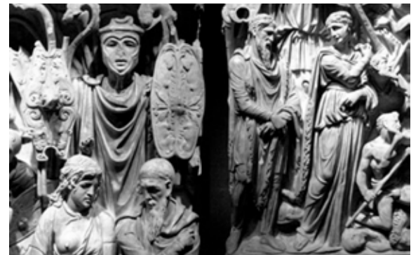
Fig. 6. Sarcófago de Portonaccio (Roma) (180-200 d. C.). Representa a los Bárbaros capturados bajo grandes trophi romanos o trofeos de batalla. La iconografía evidencia la imagen estereotipada de los Bárbaros: los hombres con la característica «trenza sueva» y larga barba; las mujeres con el cabello y rasgos también predeterminados (como podría ser el aspecto de Bissula ) y diferentes a las mujeres romanas.