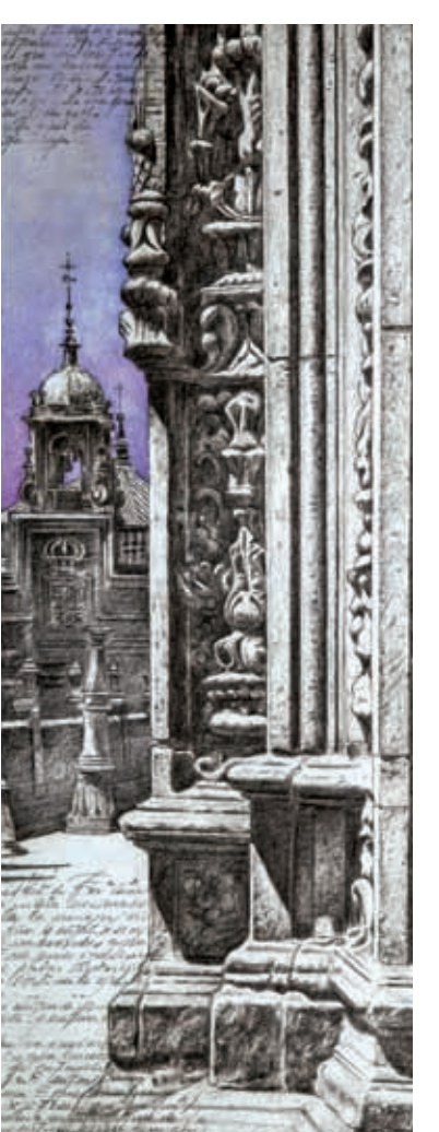
1. CASA DO CABIDO - PLATERÍAS 2. CORNISA CASA DO CABIDO