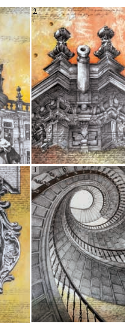
MODERNISMO S. XIX - XX

Estas mágicas figuras, inspiradas en la naturaleza y la mitología, pertenecen a dos edificios de Jesús López de Rego situados en la Alameda y la rúa do Preguntoiro. En ambos casos aportan a su entorno toda la fantasía y la sensualidad del estilo modernista con la delicadeza de su exquisito diseño. Estilos muy diversos y de épocas muy alejadas en el tiempo se suman así para enriquecer el inegable patrimonio de Compostela.