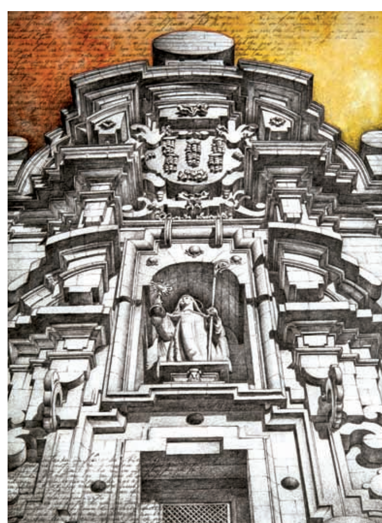
SANTA CLARA S. XVIII

Esta fachada es un elemento arquitectónico independiente, un gran retablo de piedra exento donde Simón Rodríguez desarrolla su personalísima teoría de un barroco alejado estéticamente del resto del estilo en la Península. El barroco de placas compostelano adquiere aquí su máxima expresión. La acumulación de geometrías pura produce una fachada dinámica, excesiva en la profusión de elementos pero muy rigurosa en su diseño global. El enigmático remate, un colosal cilindro pétreo, culmina este monumental juego de masas, alejado de la imagen tradicional de los pináculos compostelanos.