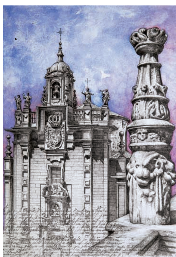
HOSPITAL REAL S. XV - XVI - XVII

Lucas Ferro Caaveiro utilizó un diseño muy vertical que resuelve esquemáticamente con sencillos motivos decorativos, como los almohadillados tallados en las pilastras que enmarcan la portada, que dotan a esta iglesia de una originalísima solución arquitectónica lograda con maestría y una gran economía de medios.