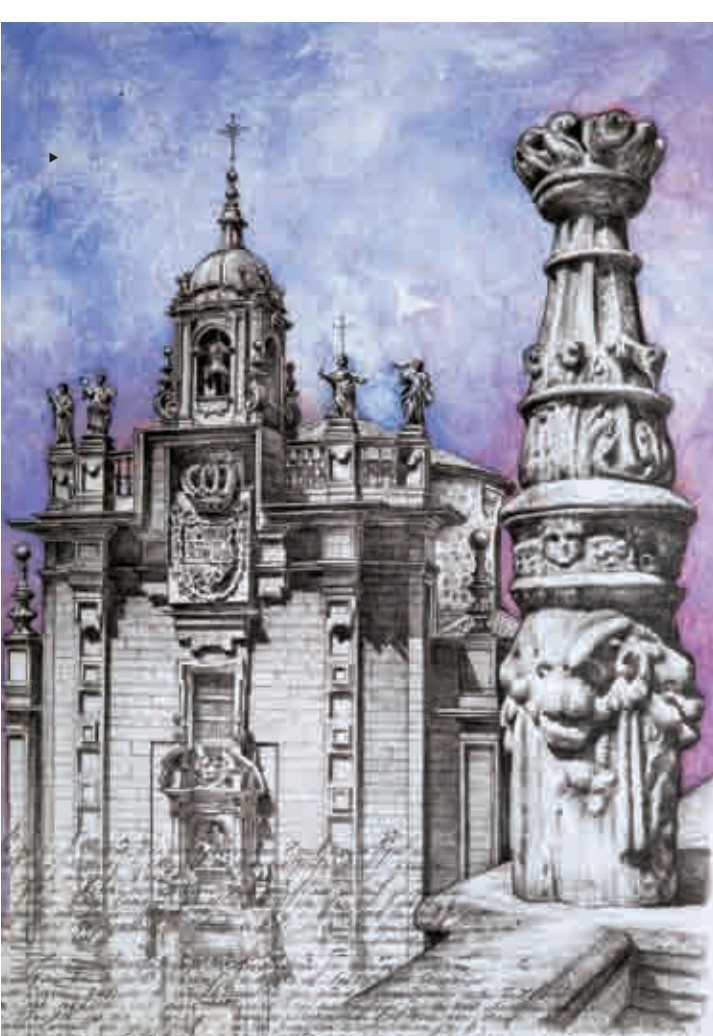
HOSPITAL REAL S. XV - XVI - XVII

A cornisa, que pertence ao estilo gótico plateresco, é unha impresionante peza escultórica de 1,7 m de altura que remata o antigo Hospital Real reclamando protagonismo nunha fachada repleta de elementos plásticos e decorativos de moi alta calidade que pugnan para mostrarse no magnífico escenario do Obradoiro. As xambas que flanquean a portada de acceso aparecen profusamente decoradas con complexos motivos ornamentais que se dilúen co paso do tempo, formando finalmente un bellísimo conxunto moi próximo á abstracción.