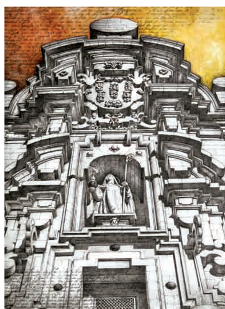
SANTA CLARA S. XVIII